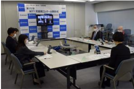
【表彰式会場：幕張テクノガーデン】