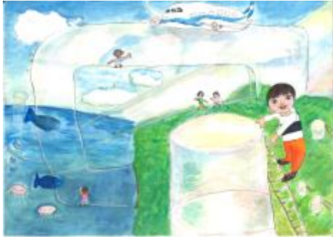
「タイトル：とう明土管でどこまでも」