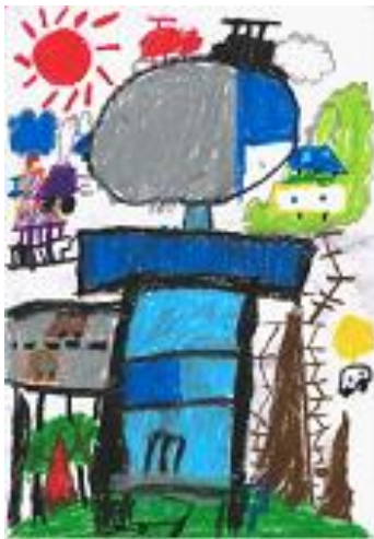
「タイトル：未来ポートタワー10000000」